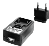
52110063 Netzteil USB