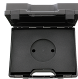
81500004 Kunststoffkasten, leer