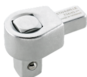
58240040 Vierkant- Einsteckwerkzeug