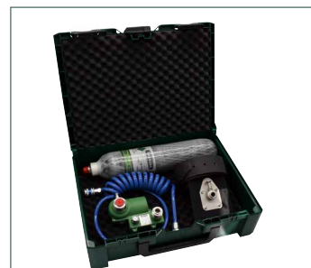
In der metaBOX

PKT-ADAPTER 400, Druckluftkartusche KT-3500, Spiralschlauch, Tragegürtel, in der metaBOX