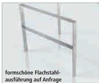
formschöne Flachstahlausführung auf Anfrage