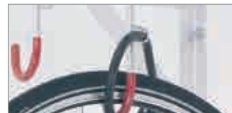
felgenschonende Kunststoff-Ummantelung, Diebstahlschutz durch Stahl-Ringöse