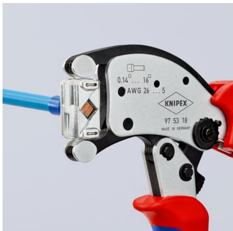
Einmalig flexibel: Verbinder können aus nahezu jeder Position in den drehbaren Crimpkopf eingeführt werden