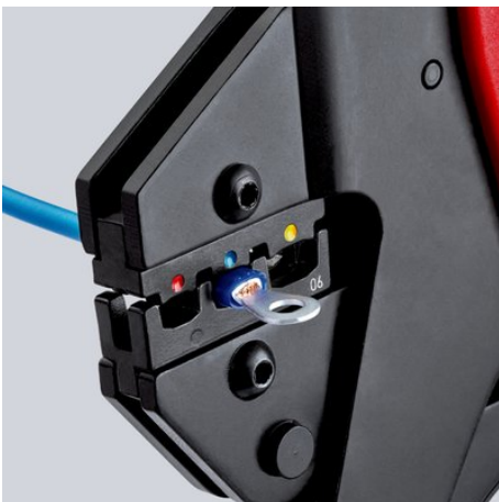
97 43 200 mit Crimpeinsatz 97 49 06 für isolierte Kabelschuhe, Steckverbinder und Stoßverbinder