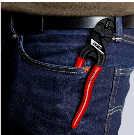
Kompakt, leicht und immer dabei

Technische Änderungen und Irrtümer vorbehalten