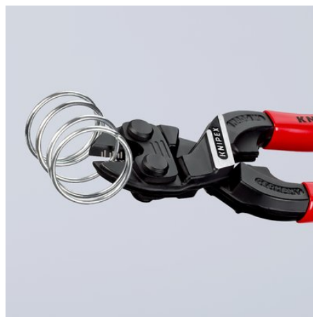
Leistungsstark bis in die Spitzen