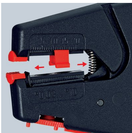
12 40 200: Einstellbarer Längenanschlag

Technische Änderungen und Irrtümer vorbehalten