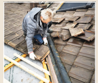
Der Fachmann beim Einbau des Marder Protect™ Universal