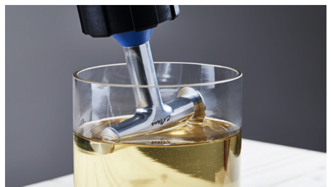
Eingetaucht in Collano HP 4000 verhindert das Aushärten des Klebstoffs in und an der Düse.