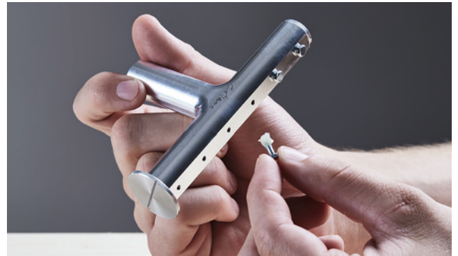
Individuelle Anzahl Klebstoffraupen durch Schliessen der Löcher mit Schrauben.